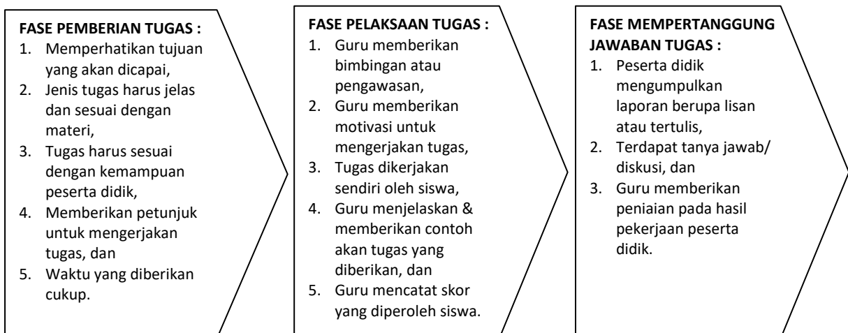
Gambar 2. Tahapan Metode Pemberian Tugas

Metode pemberian tugas dapat dikatakan efektif jika sudah mencapai sasaran atau tujuan yang diharapkan dan siswa menjadi lebih mandiri dalam mengerjakan tugas. Selain itu, hal yang tak kalah penting adalah pengalaman baru yang didapat oleh siswa dari tugas yang diberikan. Guru pun diharapkan untuk memperoleh pengalaman baru sebagai hasil dari interaksi secara dua arah dengan siswanya (Jauhar, 2011). Adapun penentuan atau ukuran dari metode pemberian tugas yang efektif terletak pada kephahaman siswa dan hasil dari yang didapatkan dari penyelesaian tugas. Berikut tahapan – tahapan yang harus dilakukan untuk menggunakan metode pemberian tugas (Zain & others, 2020) :